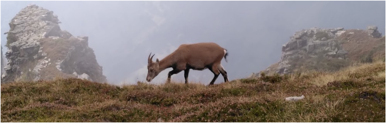
Steingeiss am Niederhorn