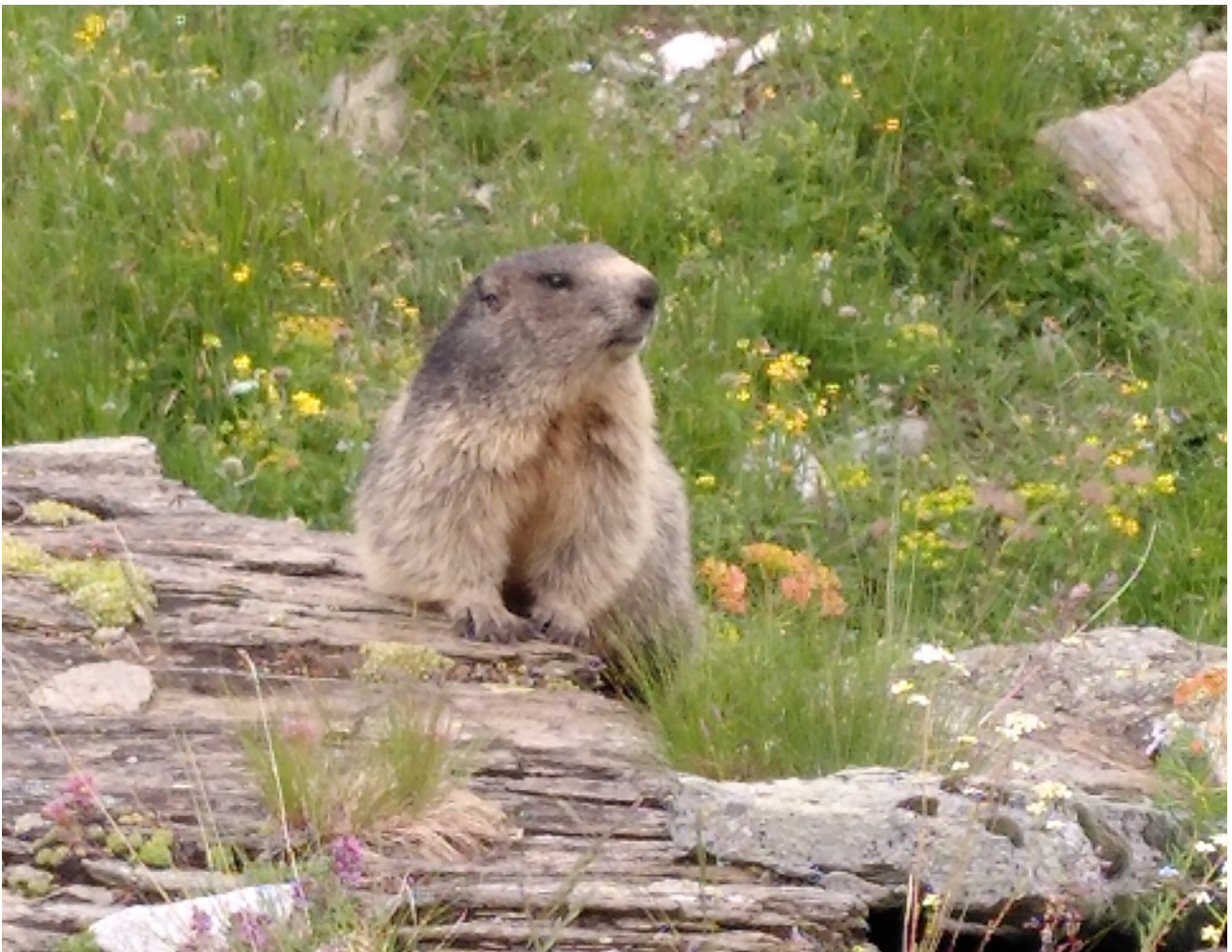
Neugieriges Murmeltier am Wegrand