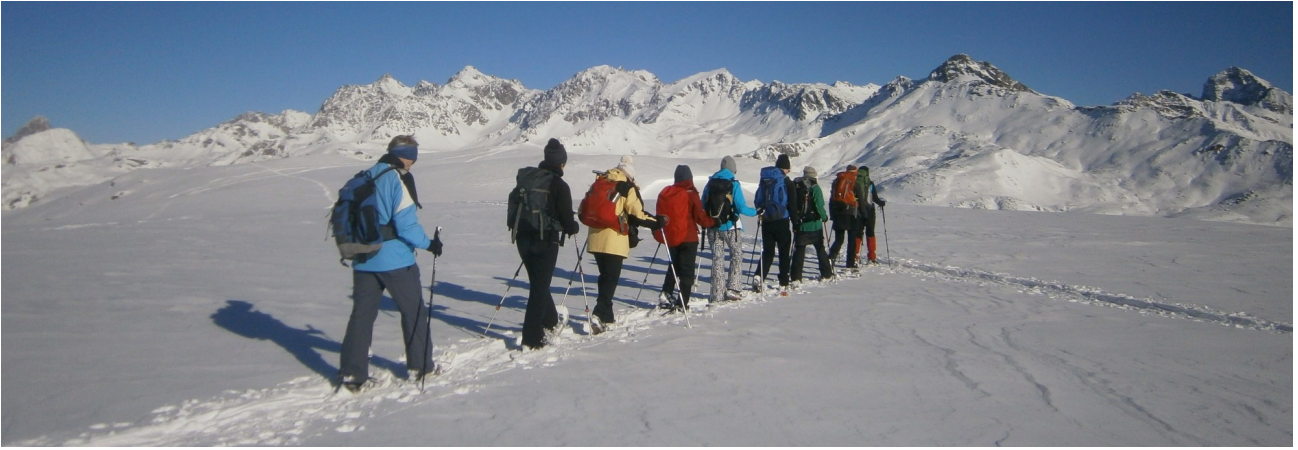
Crap da Radons