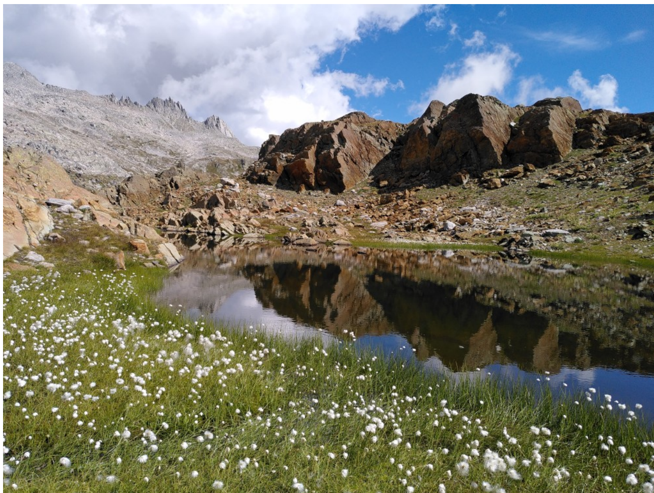
Im Serpentin am Geisspfad, Binntal