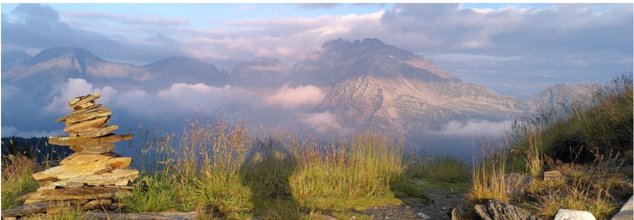
Pass de Buffalora, Calancatal