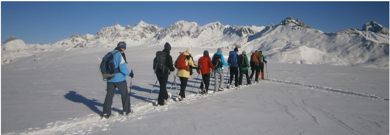
Crap da Radons