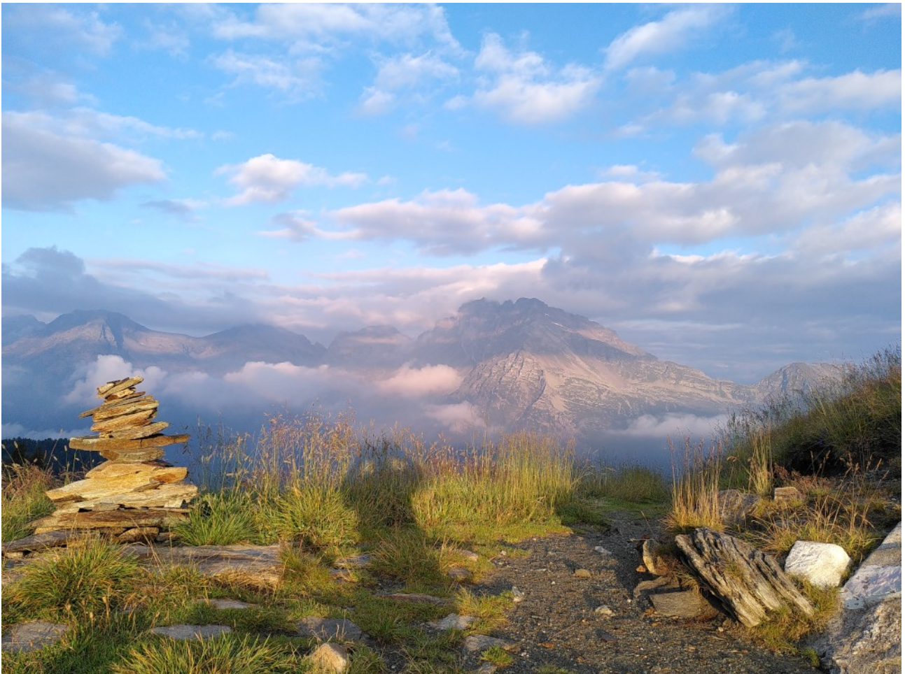
Pass de Buffalora, Calancatal