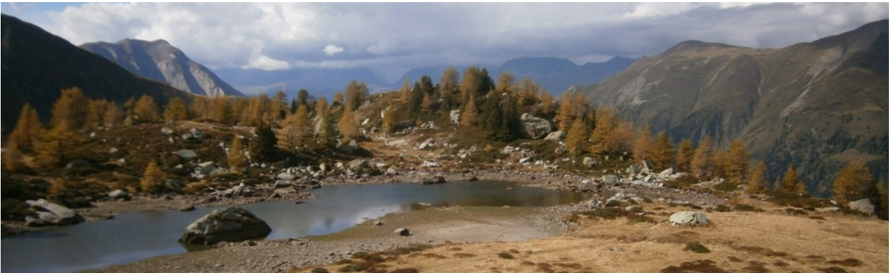
Mässersee im Binntal

Landschaftspark Binntal Perlen im Binntal Mo 23.08.2021 – Fr 27.08.2021 5 Wanderungen zu den schönsten Seen im Tal Stausee, Schaplersee, Züesee, Grengjersee, Fleischsee mittel