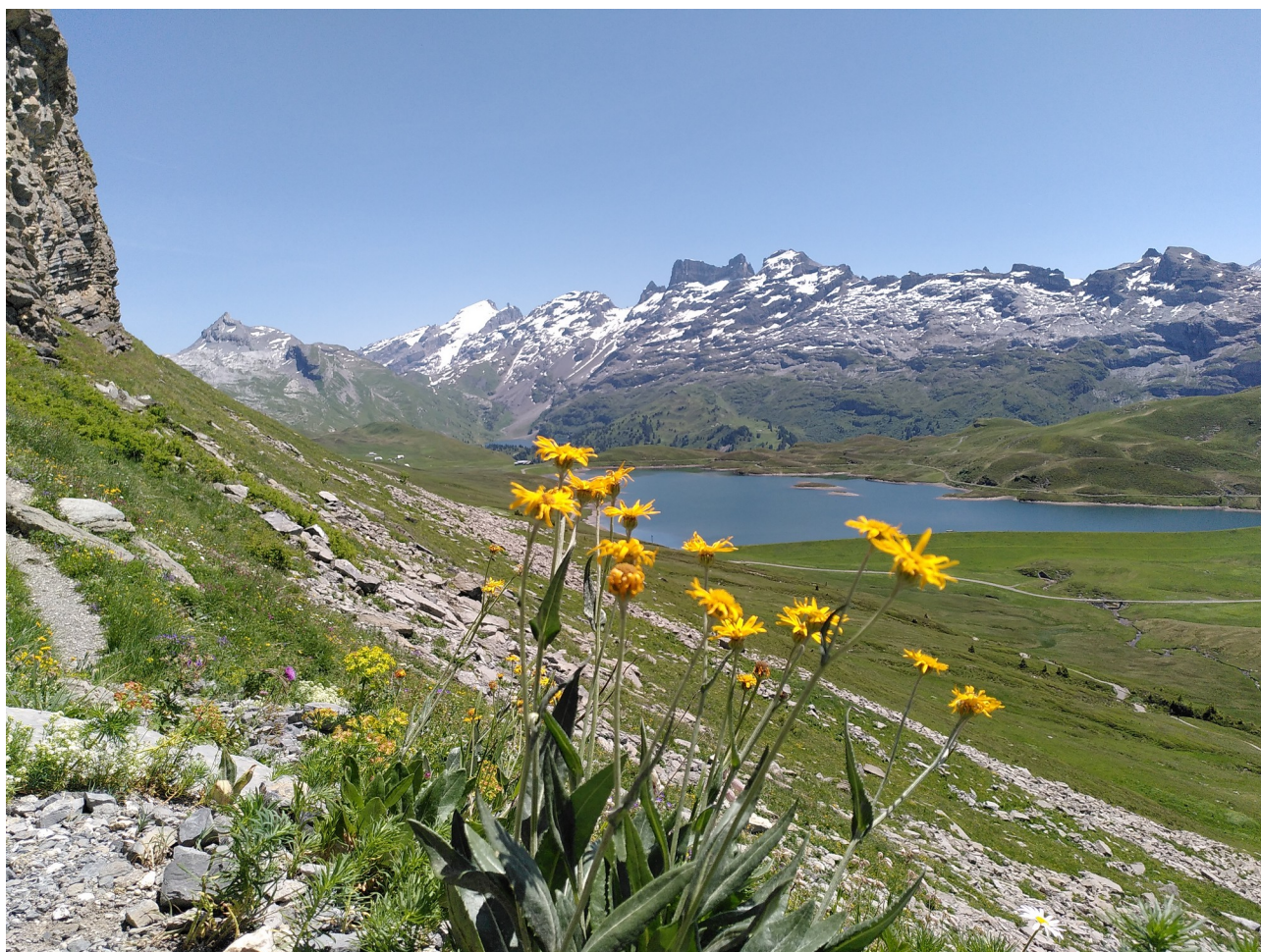
Blick auf Tannensee, Engstlensee, Titlis und Wendenstock