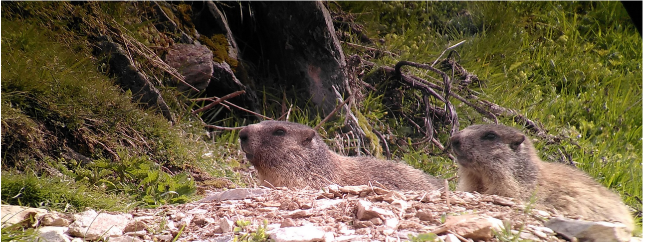
Murmeltiere im Val Müstair

Folgende Tagesexkursionen und Mehrtagestouren leite ich für Pro Natura und Per Pedes: